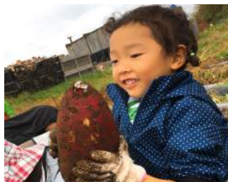
芋ほり体験 (親子向けの日帰り自然体験活動となりのビトイ)