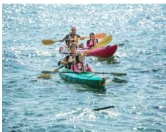
シーカヤック体験 (コープさっぽろ福島の子どもたち北海道へ遊びに行こう!ツアー)

・参加者の声 (小学四年生) いろんな人たちと仲良くなってたくさん遊びました。怒られたり、いろんなことがあったけどすごく楽しかったです。 保護者の声 キャンプから帰ってくると自分のことは自分でしてくれる様になっていて、成長を感じました。 ・ボランティアの声 (大学二年生) 子どもたちと親しくなることができ、たくさん思い出を作ることが出来ました。子どもたちも活動の中で学んだこと、感じたことを今でも覚えていてくれたらうれしいです。