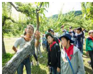
木村果樹園の見学 (コープさっぽろ福島の子どもたち北海道へ遊びに行こう!ツアー)