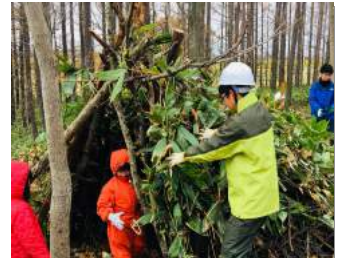
秘密基地づくり (親子を対象とした森の中の体験活動 森びらき)