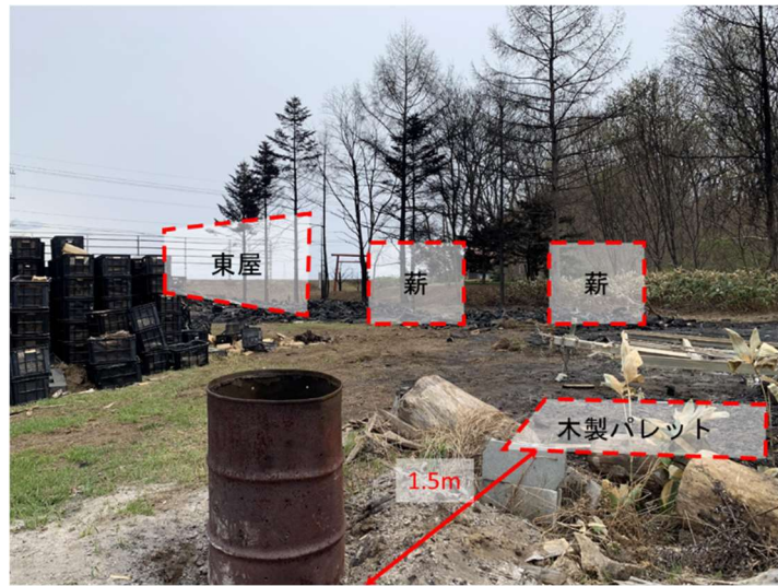
図3 出火元(ドラム缶)方向より類焼方向