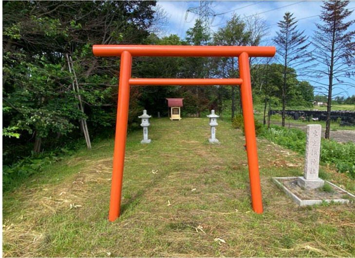
写真 12 東生振神社鳥居 清掃後