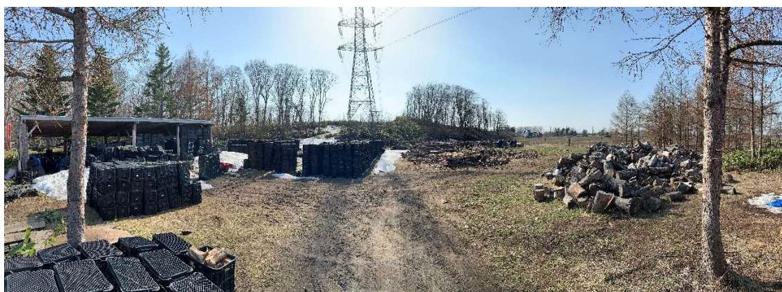
写真2 焼損前:作業所南東側入り口より全体(左:東屋、中央:薪保管列、右:材木)