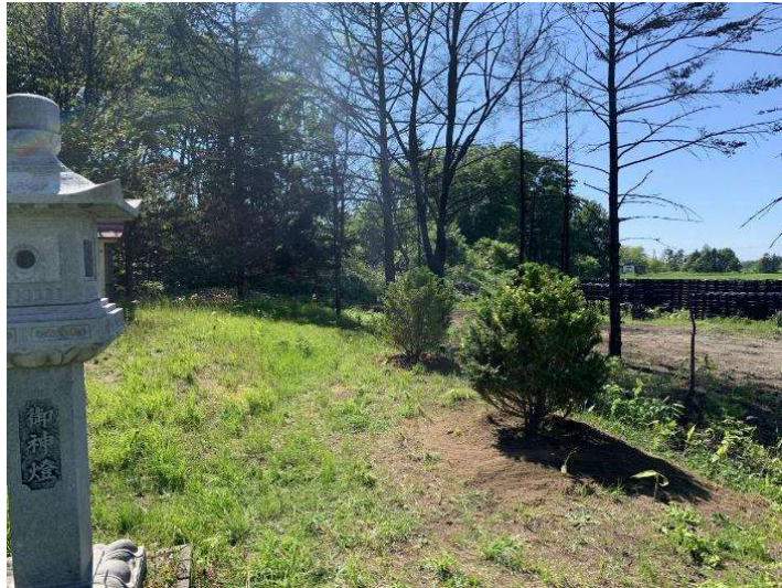
写真 13 東生振神社樹木 捕植後