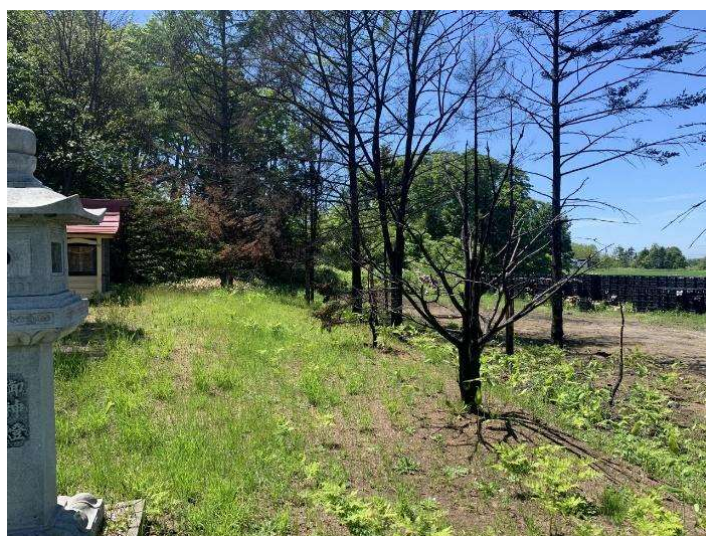
写真 6 東生振神社樹木 焼損状況