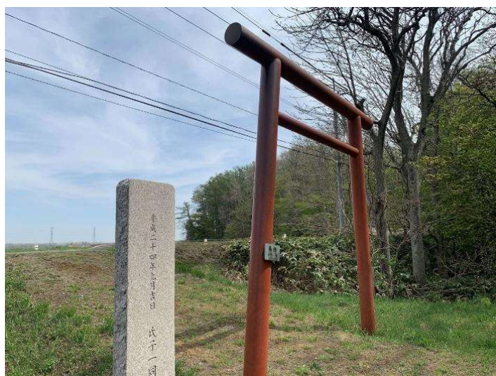
写真 5 東生振神社鳥居 すず付着