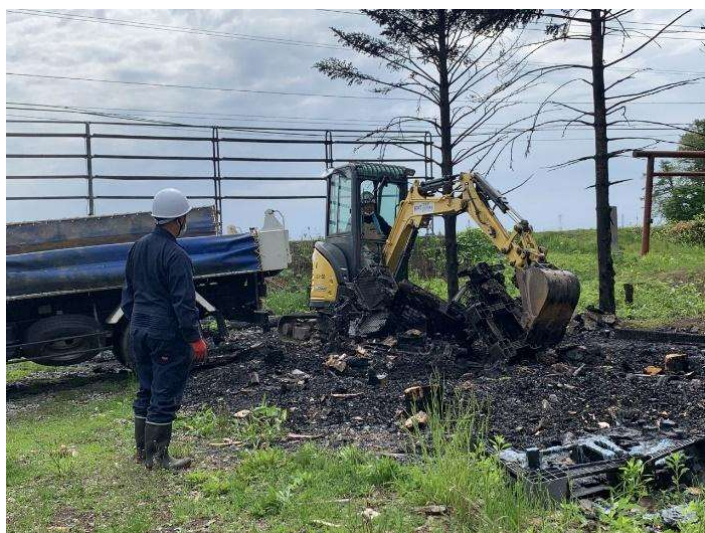
写真 10 重機によるがれき撤去