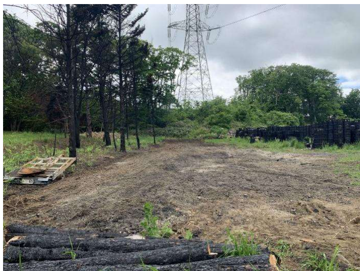
写真 11 撤去作業完了(2022年6月28日)