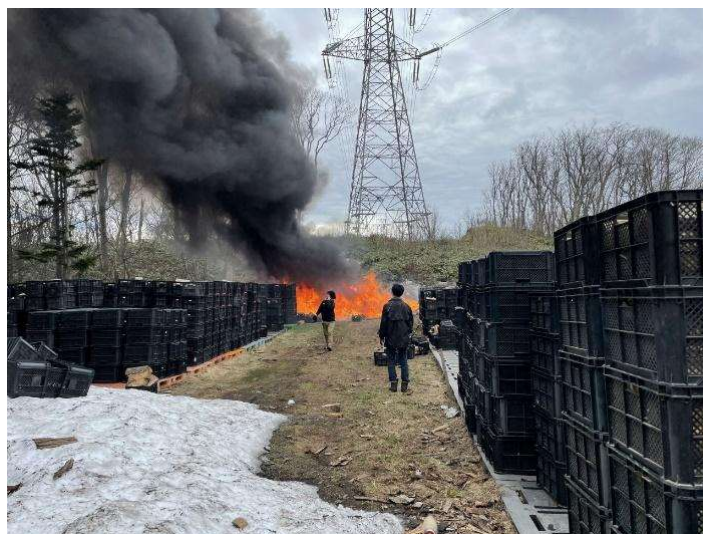
写真4 火災時の様子

作業所の焼損状況を図2に示す。作業所内では、東屋、パレット(荷役台)、農業用コンテナにて保管された薪を含む637.7㎡が焼損した。火災発生時には、東屋付近が一番激しく燃えていた。