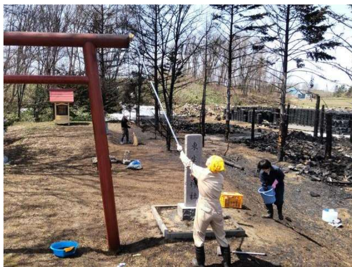
写真8 東生振神社清掃の様子