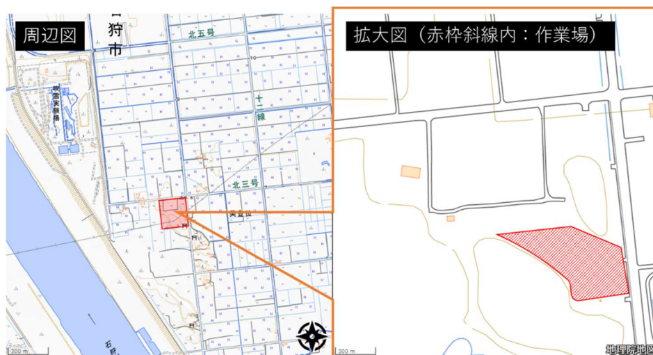
図1 作業所位置図 1