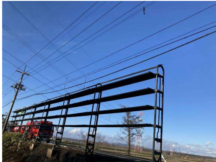
写真 7 東生振神社北側電線 焼損状況