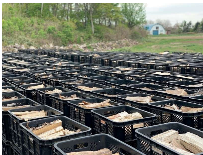
写真3 焼損前:農業用コンテナにて保管した薪