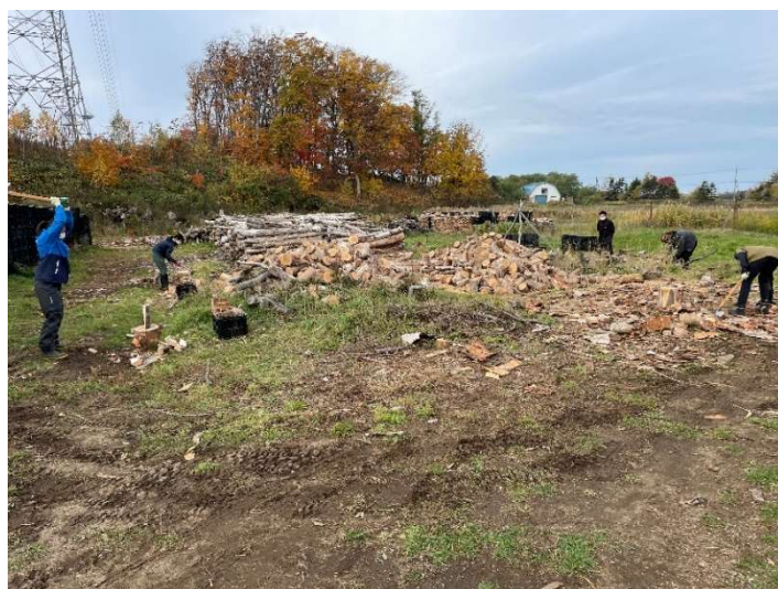
写真1 薪生産の様子

図1には美登位作業所の位置図を示す。2013年に作業所敷地東側に位置する薪保管用の東屋(写真2)を建立し、農業用コンテナに詰めた状態で薪の保管を開始した。2019年には東屋横を加工前材の保管場所としての利用を開始した。