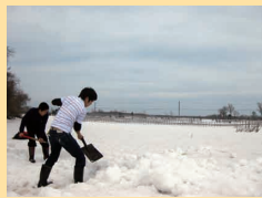
毎年春先は早めに地温を上げるため、畑上の雪を除去しています。

穫するまでの期間を逆算し、植える作物の種類やスケジュールを組み立てる会議を開いてRSRのタイミングで収穫できる野菜を選びます。