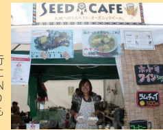
10月に静岡県で行われた朝霧JAMSにて、A SEED JAPANが出展したSEED CAFEでじゃがいもが販売されました。

RSR以外でも、野菜の販売や食に関するセミナーでの講師もっており、なんと今年は道外のイベントでじゃがいもの販売も行いました！このよう